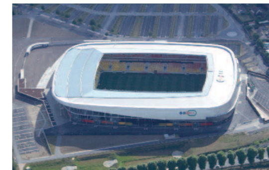
400 mètres de garde-corps autoportants droit pour sécuriser la MMA Arena