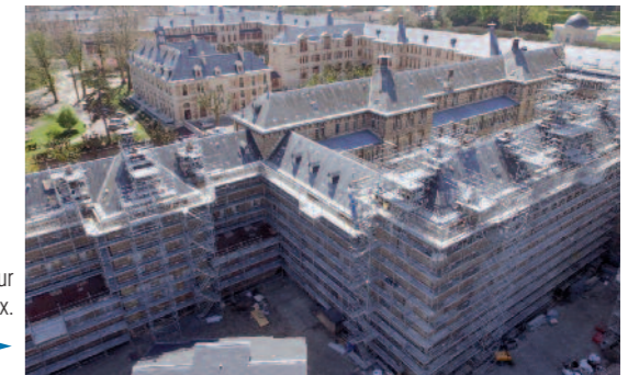
37.500 m² d’échafaudages pour restaurer le lycée Lakanal de Sceaux.