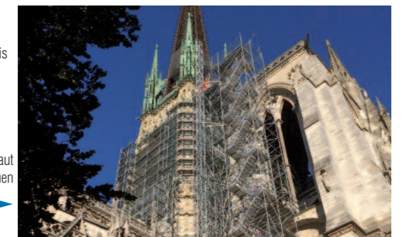
Un échafaudage de 152 mètres de haut pour restaurer la cathédrale de Rouen