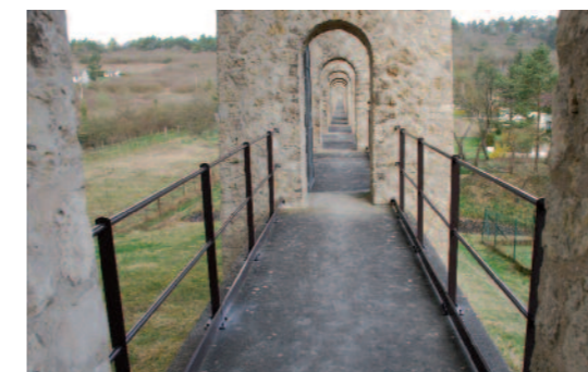
Sécurisation des aqueducs de Normandie.