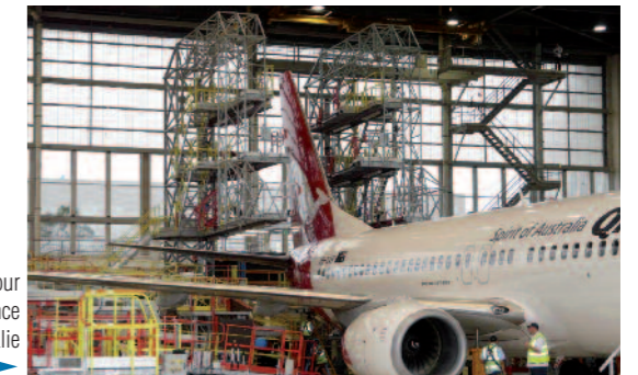
Réalisation sur mesure pour intervention de maintenance d’avions en Australie