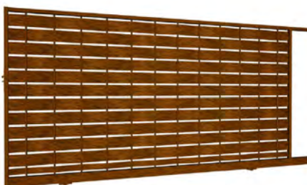
Portail coulissant - Mars