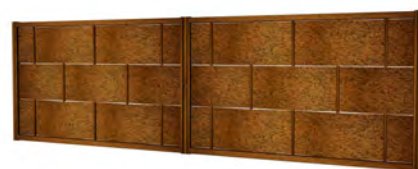
Clôture - Mars