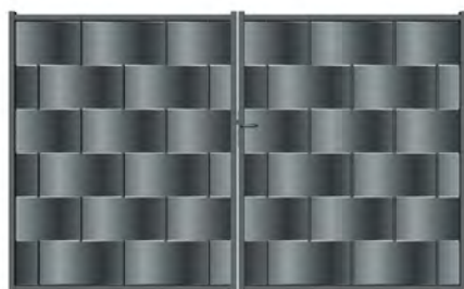
Portail battant - Gris 7016