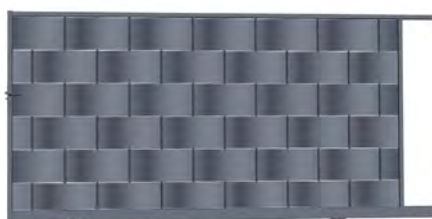
Portail coulissant - Gris 7016