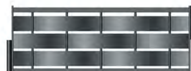
Clôture - Gris 7016