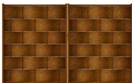
Eria, modèle plein déposé avec des lames larges