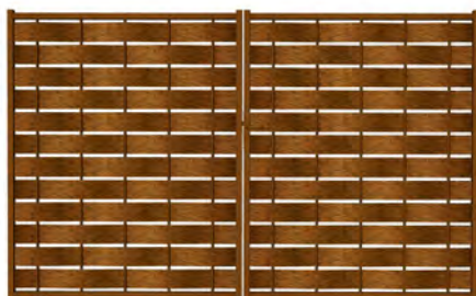
Portail battant - Mars