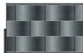
Clôture - Gris 7016