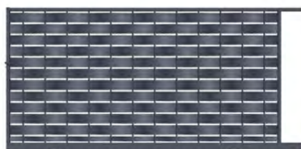
Portail coulissant - Gris 7016