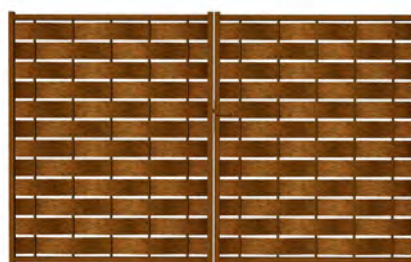
Eria, modèle ajouré déposé avec des lames étroites