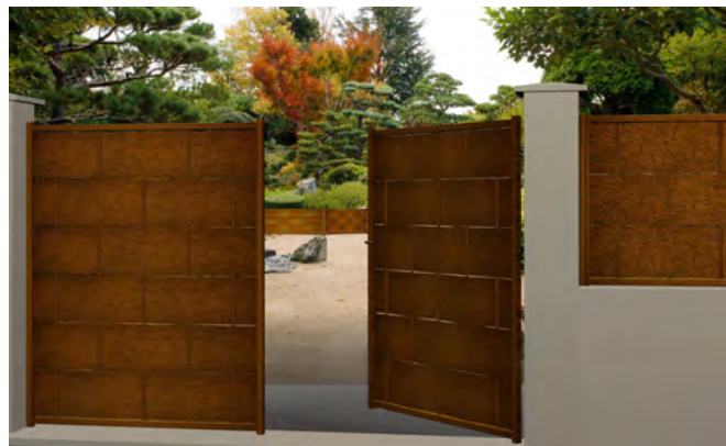
Déclinaison de la gamme Eria en concept complet