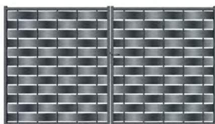
Portail battant- Gris 7016